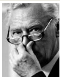
POUL SCHLÜTER. Konservativ statsminister 1982-93.