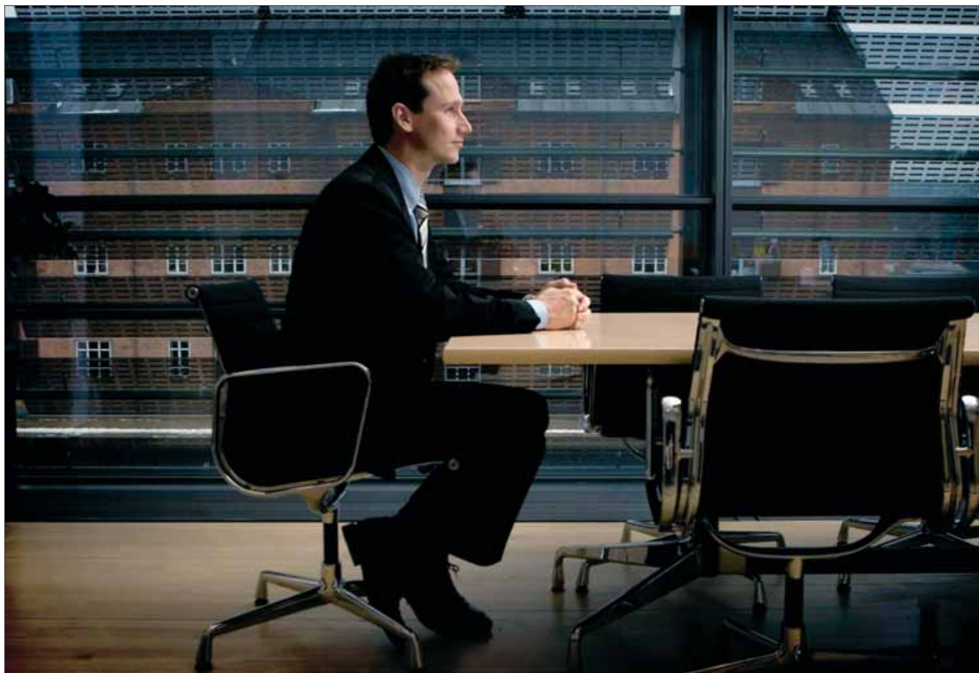
SKATTEFRIHED. Venstres skatteminister, Kristian Jensen, er en varm fortaler for skattefrie frynsegoder. Og der kommer flere og flere af dem. Men hvordan har han det med, at hans ministerium samtidig kører en kraftig kampagne for at lægge sort arbejde for had. Og med at hans partifælle finansministeren ikke vil have frynsegoderne inden for statens døre.