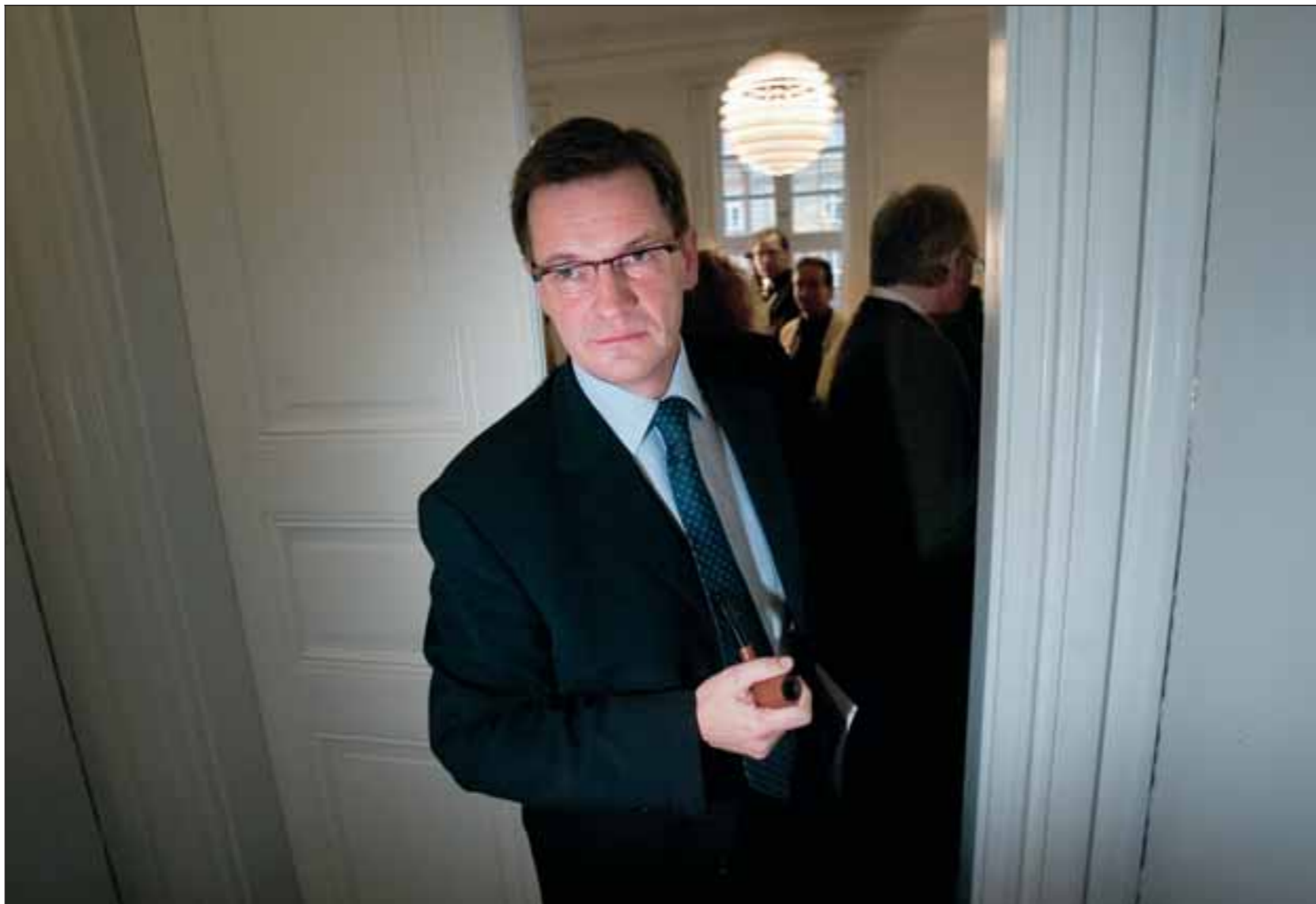
GOD SKIK. Bendtsen vil lade Finanstilsynet undersøge, om de finansielle institutter overholder 'god skik-reglerne', når det gælder markedsføring.

Økonomi- og erhvervsminister Bendt Bendtsen kommer ikke og tørrer op for boligejerne, når renten stiger.